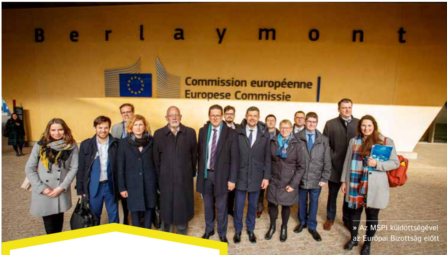
» Az MSPI küldöttségével az Európai Bizottság előtt

Olyan parlamenti munkára készültem, amely közelebb hozza az Európai Uniót a polgárokhoz és figyel a kisebbségi jogokra. A közvetlen cél egyértelmű: előbbre vinni a Minority SafePack kisebbségi kezdeményezés ügyét az uniós intézményrendszerben.