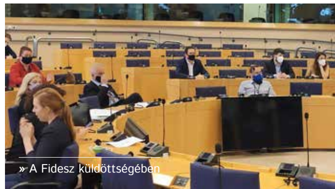
» A Fidesz küldöttségében