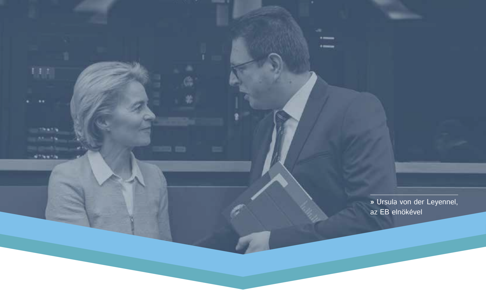
» Ursula von der Leyen, az EB elnökével